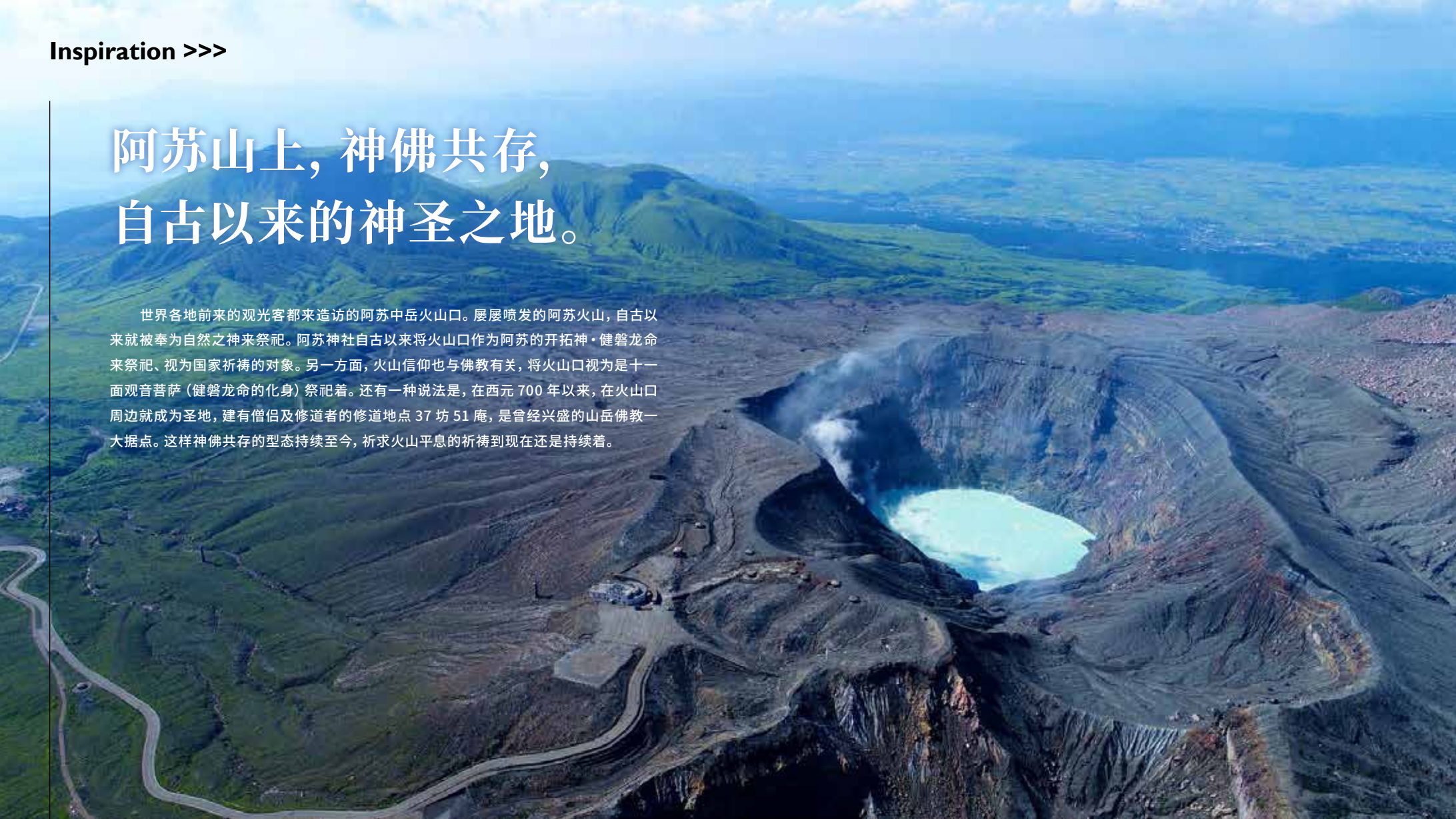
烟雾袅袅升起的壮观阿苏火山。被称为御池参拜的登山口，也被列为信仰的对象。

世界各地前来的观光客都来造访的阿苏中岳火山口。屡屡喷发的阿苏火山，自古以来就被奉为自然之神来祭祀。阿苏神社自古以来将火山口作为阿苏的开拓神·健甕龙命来祭祀、视为国家祈祷的对象。另一方面，火山信仰也与佛教有关，将火山口视为是十一面观音菩萨（健甕龙命的化身）祭祀着。还有一种说法是，在西元700年以来，在火山口周边就成为圣地，建有僧侣及修道者的修道地点37坊51庵，是曾经兴盛的山岳佛教一大据点。这样神佛共存的型态持续至今，祈求火山平息的祈祷到现在还是持续着。