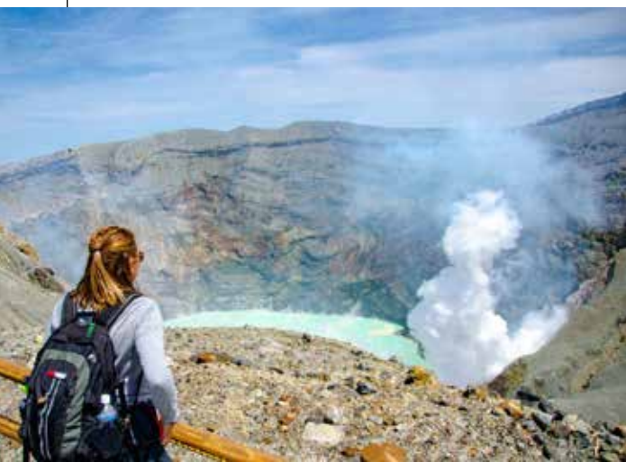
使用阿苏山公园收费道路的话，就能驱车前往到火山口附近。

可以说是阿苏象征的中岳火山口与草千里滨。宛如是火星景观的辽阔砂千里滨。这里聚集了壮观秀丽的3大景点，可以一起来造访看看。能够轻松地参观直径600m活跃中的火山口。