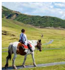
草千里滨可以体验骑马。