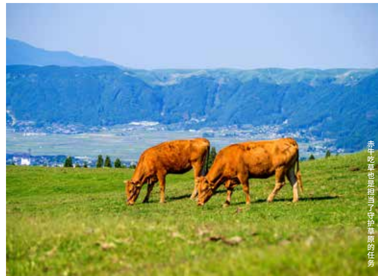
赤牛吃草也是担当了守护草原的任务

草原上的雨水蒸发量少，比起森林，它有更好的储存地下水功能。渗入阿苏草原的地下水，成为了白川及筑后川等6条河流的源流，支撑起福冈市及熊本市等的生活用水。