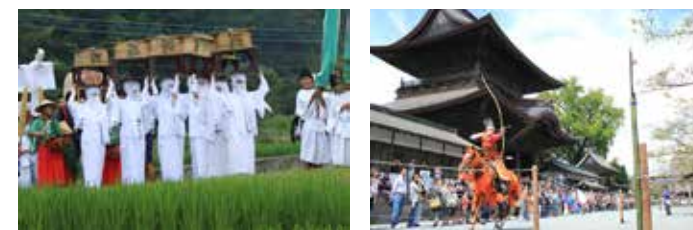
▲御田祭。伴随众神明的是全身穿上白色装束的女性（宇奈利）等，约200人的队伍。 ◀撒火祭神仪式中，可以看到火圈交织的样子，非常壮观。 ▼田实祭中，会举行还愿相扑及流镇马（骑马射箭）作为敬奉活动的祭神仪式。