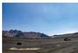
在大面积的砂地被火山灰覆盖的砂千里滨里，能看见火山特有的荒凉景色。

参观阿苏中岳火山口、砂千里滨 阿苏山公园收费道路的开放时间 【3/20～10/31】8:30～18:00（17:30关闭闸门） 【11/1～11/30】8:30～17:30（17:00关闭闸门） 【12/1～3/19】9:00～17:00（16:30关闭闸门） ※全年无休，但因火山活动等会有入场限制的情况 摩托车200日元，轻型汽车600日元，普通汽车800日元，小型巴士2,500日元，中型巴士3,000日元