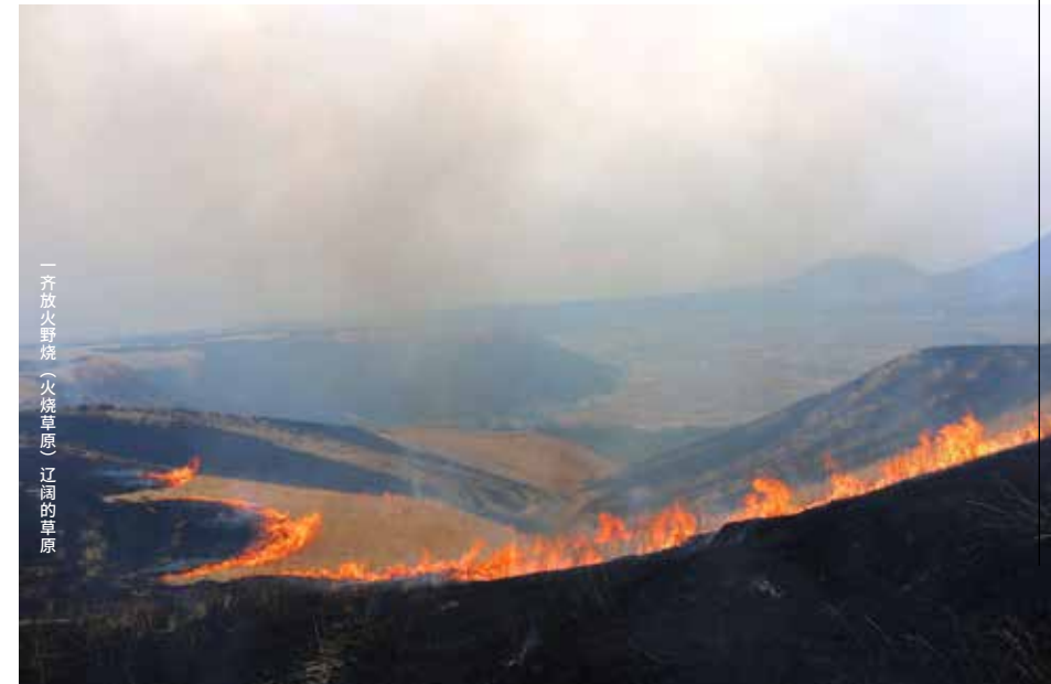
一齐放火野烧（火烧草原）辽阔的草原

阿苏草原历经千年以上，经由人为持续不断地进行野烧（火烧草原）、放牧牛马及割草的循环被守护着。野烧（火烧草原）是利用野烧防止草原森林化，对于驱除动植物的病虫害等有着很大的作用。但野烧（火烧草原）作业需要很多人手，由于畜产农家的减少及高龄化等的因素，变得很难存续下去。今后，要维持草原的状态，就必须要有义工，还需要更多的理解和支持。