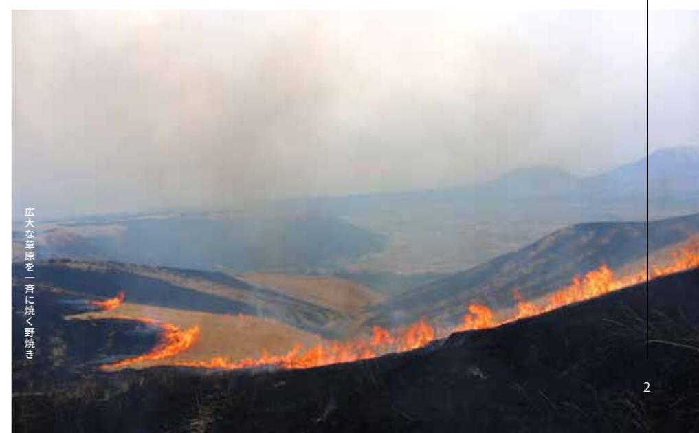
広大な草原を一言に焼く野焼き