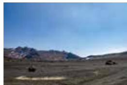
火山灰で覆われた砂浜が広がる砂千里ヶ浜では、火山ならではの荒涼とした景色を見ることができます。

阿蘇中岳火口見学・砂千里ヶ浜 阿蘇山公園有料道路の開放時間 【3/20～10/31】8:30～18:00（17:30ゲート閉門） 【11/1～11/30】8:30～17:30（17:00ゲート閉門） 【12/1～3/19】9:00～17:00（16:30ゲート閉門） ※年中無休、火山活動等により立入規制がかかる場合があります ※単車200円、軽自動車600円、普通車800円、マイクロバス2,500円、中型バス3,000円