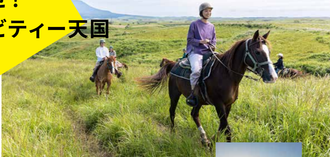
馬とのふれあいで阿蘇を体感！

雄大な自然に抱かれた阿蘇は、サイクリングや乗馬、フルーツ狩りなどのアクティビティー天国でもあります。阿蘇でしかできないワクワクの体験を！