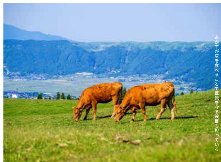
あか牛が草を食入ることで草原を守る役目も担っている

草原は雨を蒸発させる量が少なく、森林よりも地中に水を貯える機能が高いとされます。阿蘇の草原でしみ込んだ地下水は、白川や筑後川など 6 河川の源流となり、福岡市や熊本市などの生活水を支えています。