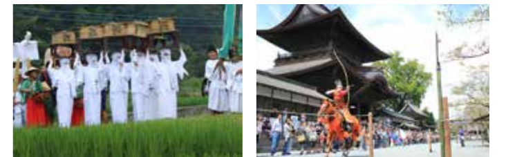
▲御田祭。神々のお供をするのは、全身白装束の女性（宇奈利うなり）など約200人の行列です。 ▼火振り神事では、火の輪が幾重にも重なり合って見える様が壮観。 ▼田実祭では、奉納行事として神事である願の相撲や流鏑馬（やぶさめ）が行われます。