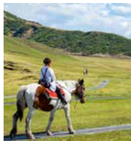
구사센리가하마에서는 승마 체험도 가능.