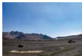
화산재로 덮인 모래사장이 펼쳐진 스나센리가하마에서는 화산 특유의 황량한 경치를 볼 수 있습니다.

아소 나카다케 분화구 견학, 스나센리가하마 아소산 공원 유료도로 개방시간 [3/20~10/31] 8:30~18:00 (17:30 게이트 폐문) [11/1~11/30] 8:30~17:30 (17:00 게이트 폐문) [12/1~3/19] 9:00~17:00 (16:30 게이트 폐문) ※연중무휴, 화산 활동 등에 의해 출입이 규제될 수 있습니다. 이륜차 200 엔, 경차 600 엔, 승용차 800 엔, 마이크로 버스 2,500 엔, 중형 버스 3,000 엔