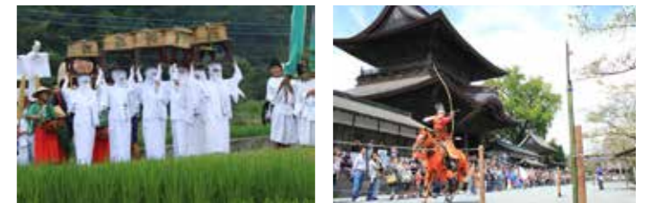
▲ 온다 마츠리 (御田祭). 신들을 모시고 있는 것은 천신 흰 옷을 입은 여성 (우나리) 등 약 200 명의 행렬입니다. ▲ 히후리신지에서는 불고리가 걸걸이 걸쳐 보이는 모습이 장관. ▼ 다노미사이 (田実祭) 에서는 봉납 행사로서 신사에게 기원하는 소모나 야부사마 (유적마) 가 열립니다.