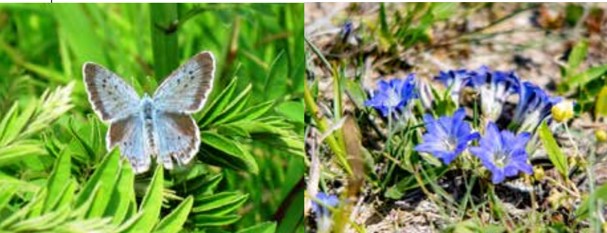
멸종 위기종인 큰홍띠점박이푸른부전나비 (Shijimiaeoides divinus)

아소 초원에서 볼 수 있는 식물은 희귀한 것을 포함해 600여 종. 야생 동물과 야생 조류, 곤충이 살 수 있는 환경을 가꾸고, "나비들의 낙원"이라 불릴 정도로 다양한 나비가 서식하고 있습니다.