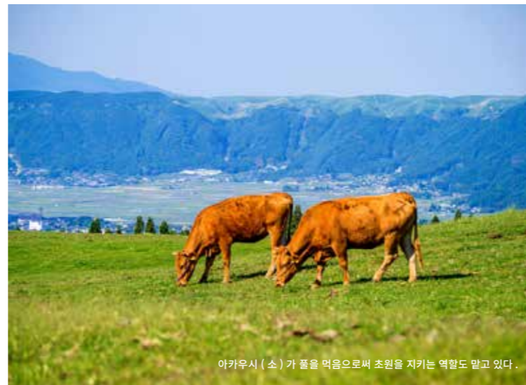
이카우시 (소)가 풀을 먹음으로써 초원을 지키는 역할도 받고 있다.

초원은 비가 증발하는 양이 적고, 삼림보다도 땅속에 물을 저장하는 능력이 높다고 합니다. 아소 초원으로 스며든 지하수는 시라카와 강이나 지쿠고가와 강 등 6대 강의 원류가 되어, 후쿠오카시나 구마모토시 등의 생활수가 되고 있습니다.