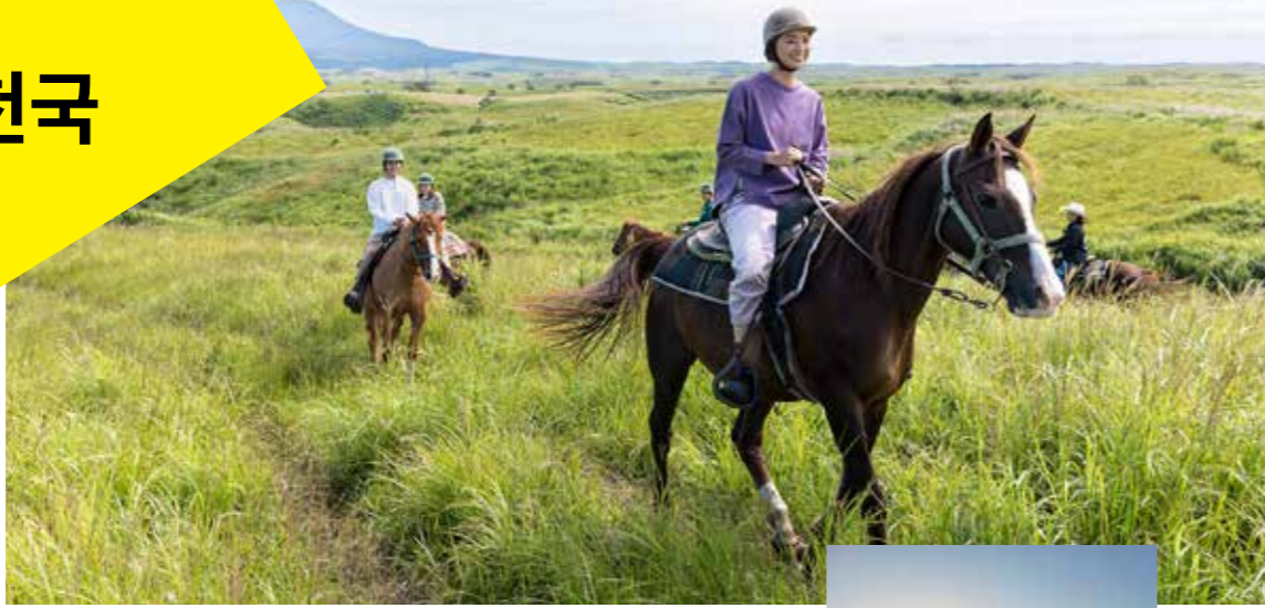
말과의 만남으로 아소를 체험!

웅장한 자연 품에 있는 아소는 사이클링, 승마, 과일 따기 등 액티비티의 천국이 기도 합니다. 아소만의 두근두근 설렘 체험을!