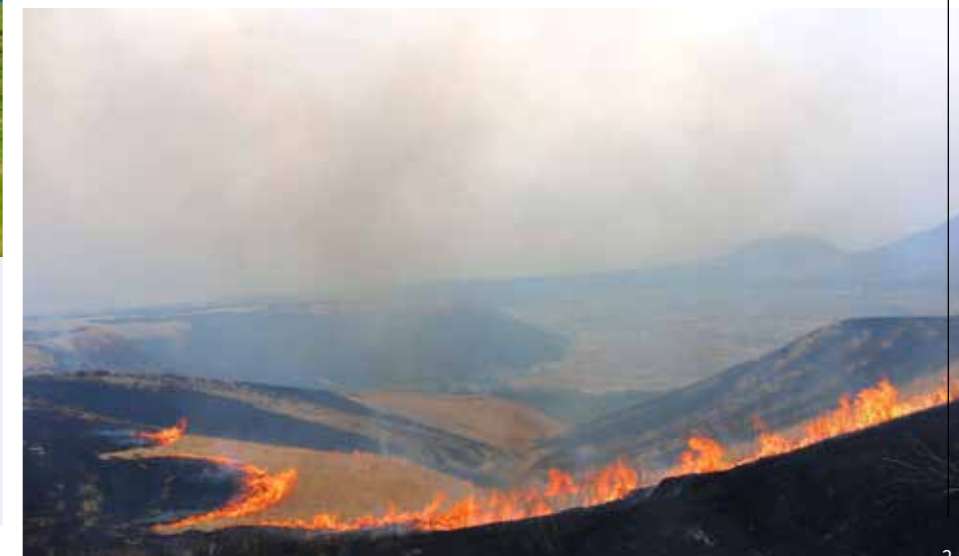
광활한 초원을 일제히 태우는 노야키 (들판 태우기)

아소 초원은 들불 놓기나 우마 방목, 채초 사이클을 반복하여 천년 이상 사람의 손에 의해 지켜지고 있습니다. 노야키 (들판 태우기)는 초원을 태움으로써 숲이 되는 것을 막고 동식물 병충해 구제를 하는 등 중요한 역할이 있습니다. 노야키 (들판 태우기) 작업에는 많은 인력이 필요하지만, 축산 농가의 감소와 고령화 등으로 이어가기가 어려워지고 있습니다. 앞으로도 초원을 유지해 나가기 위해서는 자원 봉사자를 비롯한 많은 사람들의 이해와 지원이 필요합니다.