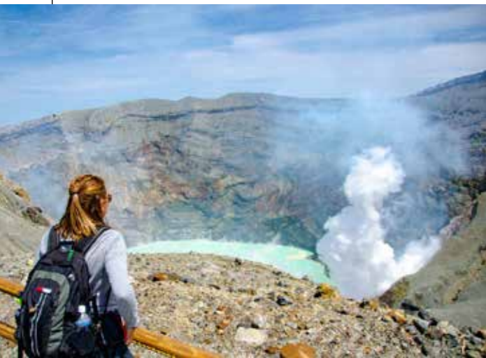
아소산 공원 유료 도로를 사용하면 화구 근처까지 자동차로 접근할 수 있습니다.

아소 상징이라고 할 수 있는 나카다케 분화구와 구사센리가하마. 마치 화성 같은 경관이 펼쳐지는 스나센리가하마. 웅장하고 아름다운 경관을 자랑하는 3대 명소는 지역이 정해져 있어, 함께 방문해 봅시다. 부담 없이 직경 600m의 활동 중인 화구를 둘러볼 수 있습니다.