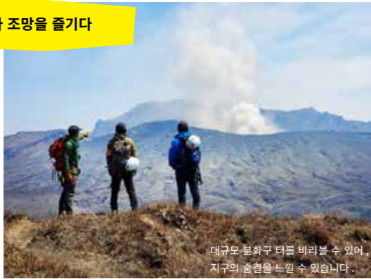
풀 파노라마 조망을 즐기다

아소산과 구주 연산을 한눈에 볼 수 있는 해발 850m의 북외륜산(北外輪山)에 위치한 그린밸리. 그 부지 면적의 넓이는 실로 도쿄 돔 약 32개분! 광활한 360도 파노라마 초원과 산과 계곡의 변화무쌍한 대자연을 걷고 달리며 만끽하는 「호스 트 레킹」을 체험할 수 있습니다. 원하는 레슨을 받은 후, 호스 트레킹도 가능. 탁 트 인 초원을 마음껏 즐길 수 있습니다.